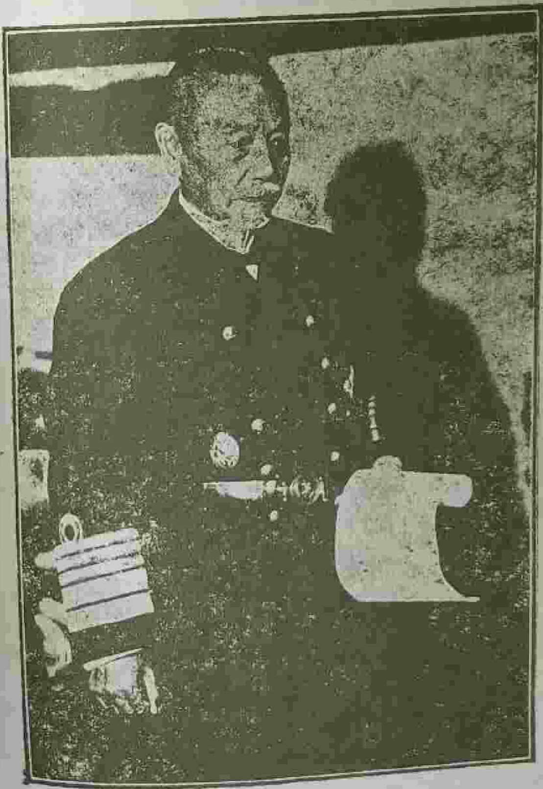
ከጃፓን : ታላላቅ : ሰዎች : አንዱ : አሚራል : ቶጎ ።

አፕሪል : 1942 : ከጃፓን : መጽሐፍ : ውስጥ : የቀረቡ : ሰዎች ።